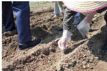
30cm間隔で 種を撒きます