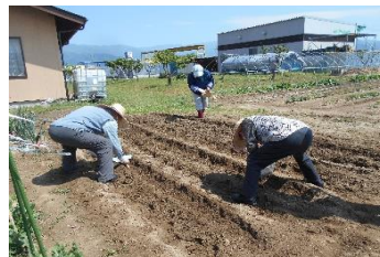
団扇と藁を使って 等間隔に種まき