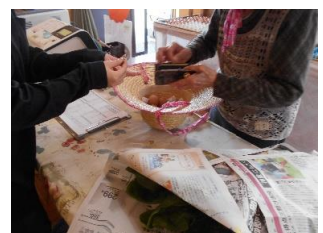
新鮮な平飼い卵を お買い上げ

社会参加活動の一つ、くりのみ園での活動とエコバック作りの活動。ふたつの社会参加活動がご縁となり【綿づくり】という新たなご利用者様の活躍の場所が増えました。今後ご利用者様の社会参加の場所作りの拡大をしていきたいと考えています。