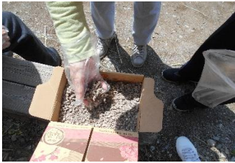
これが綿の種です

早速、綿の種まきを行って来ました。種を30cm間隔位に2、3粒撒いていきます。今回はおおよそ30cm程の藁と団扇を使って種の間隔をとって行きました。作業後は、新鮮な卵とほうれん草を買って帰られました。